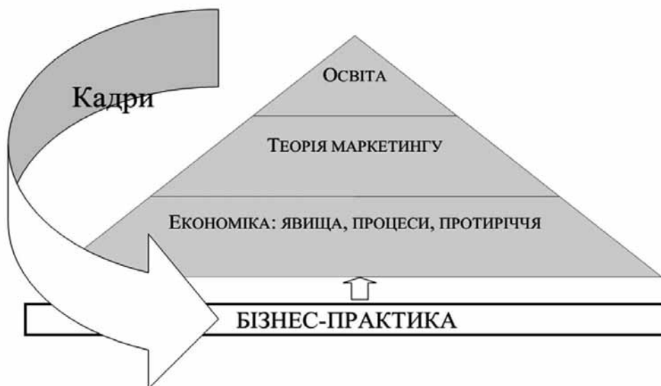
Рисунок 1. Світовий досвід становлення маркетингу

Отже, основою становлення маркетингу в Україні стали перші університетські кафедри. Пригадую і свій досвід здобуття освіти в галузі маркетингу. В 1992р. зовсім випадково перед Новим роком з колегою по КПІ в якому я тоді працювала проходили повз офіс однієї з міжнародних організацій, вона згадала, що їй стало відому, про те, що тут приймають анкети претендентів для участі у всеукраїнського конкурсі на здобуття стипендії на навчання в університеті Торонто (Канада) в галузі маркетингу. Ми зайшли